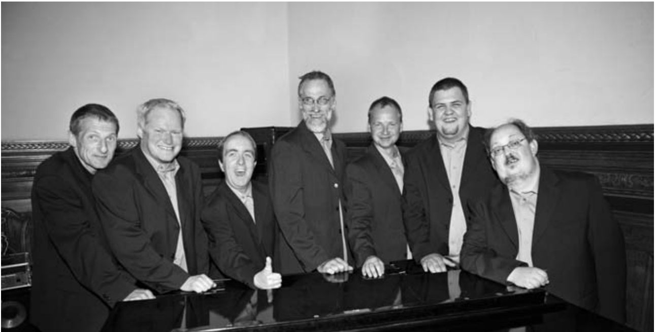
Sidste års opmuntringsprismodtager Karavana Band fra Århus var med til at gøre jubilæumsdagen ekstra festlig